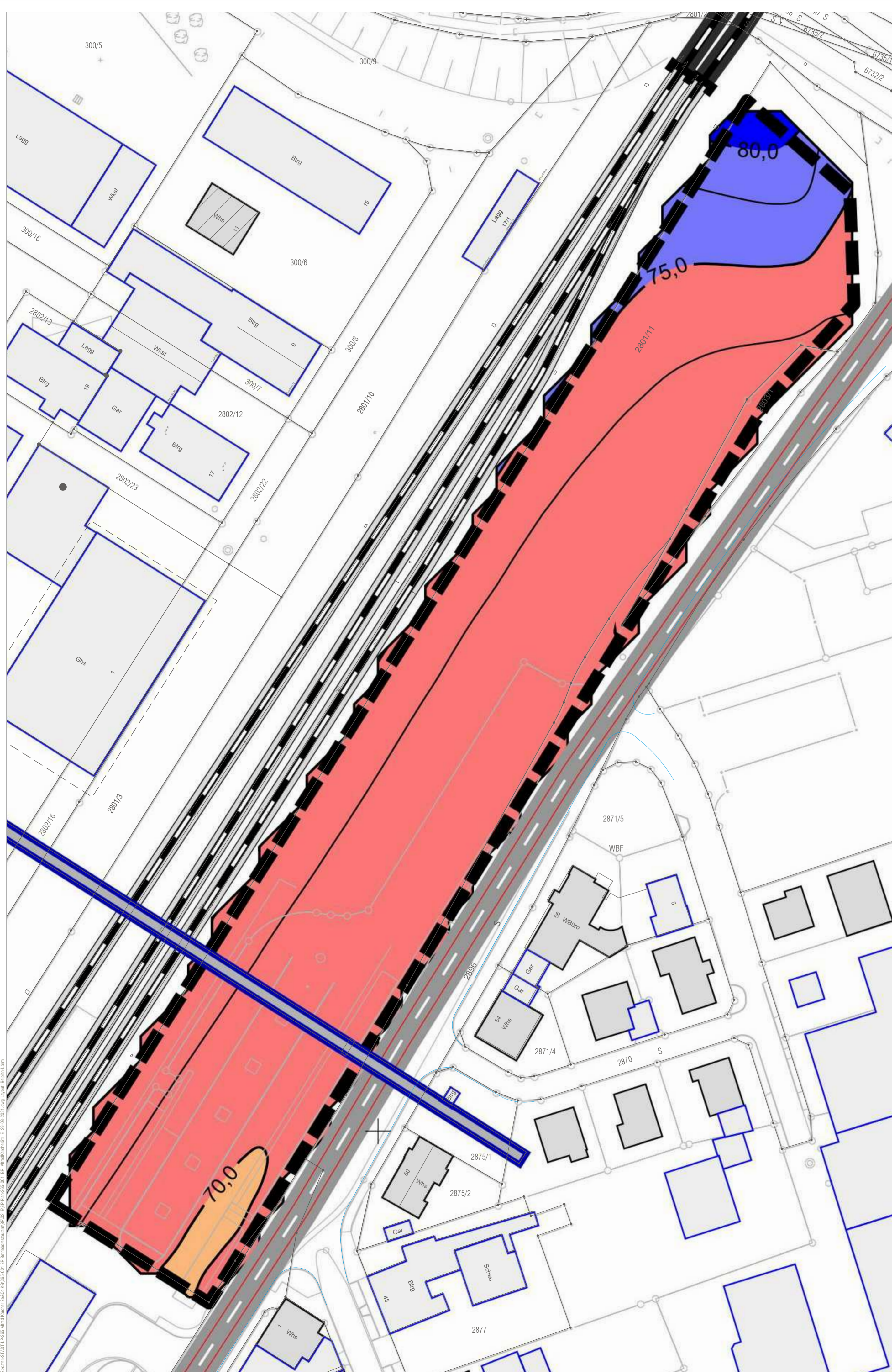
Maßgeblicher Außenlärmpegel nach DIN 4109, tags